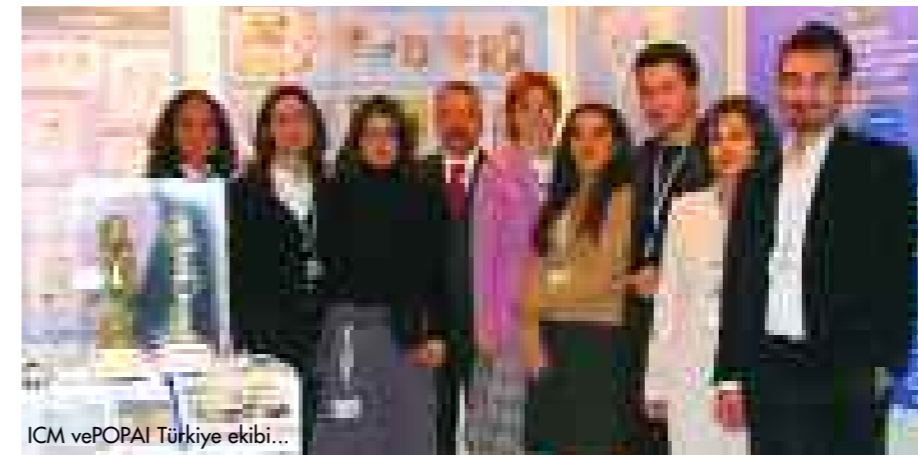
ICM ve POPAI Türkiye ekibi...

Uzun yıllardır sektörün "Oskar"ı kabul edilen OMA (Outstanding Merchandising Achievement), her yıl Globalshop'ta büyük bir organizasyon ile değerlendirilerek, çeşitli kategorilerde dağıtılıyor. Firmalar ve tasarımcılar eserlerini oluşturup OMA'ya Ocak ayında başvurularını yaparak katılırlar.